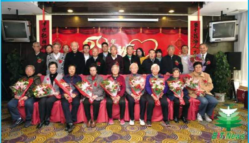
2013 11! 5" # $ % & ' * +, -. / 0 1 2 3 4 5 6 7 8 9 : : % = > ? @ A B C D E > ? B E F G H I J K L M B N O 2013 = > ? @ A B P Q R S T U V W X Y Z [ \ ' C D ] ^ _ N ' & ' b c d e f g R S h i % k l m n l 3 8 o P Q p q r s t 1 4 o u v k l w x m n y z { | } ~ U. l % R V 8 l \ (文 / 离退休教职工党委 离退休工作处)

$ % 4 5 6 7 8 9 : ; < = > ? / @ A B C ( D 3