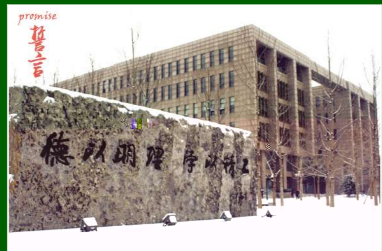
▲ 再见,见证我们青葱时光的校园