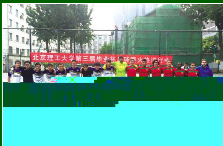
▲ 我们曾在赛场拼搏,谁与争锋