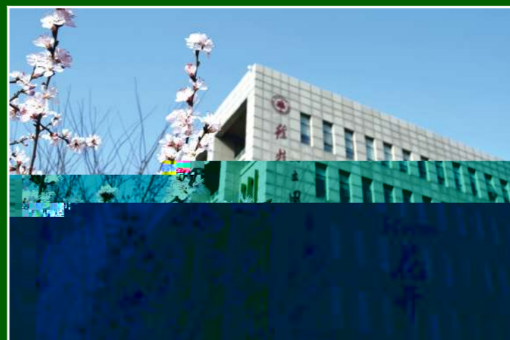
▲ 再见,我们共同的家