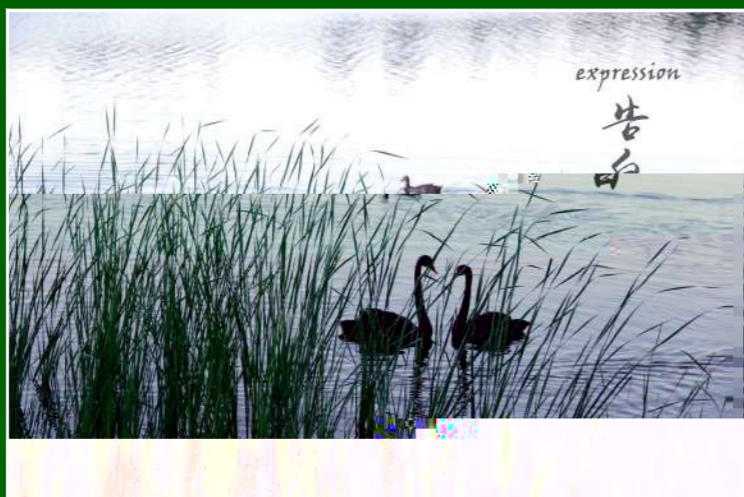
▲ 我们曾在湖边冥想,浮生如寄