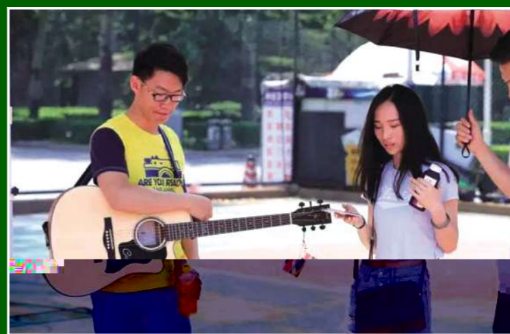
▲ 我们曾在校园放歌,一生有你